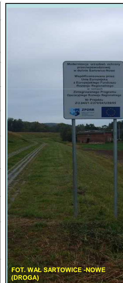
FOT. WAŁ SARTOWICE -NOWE (DROGA)