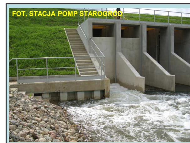
FOT. STACJA POMP STAROGRÓD

Projekty zrealizowane w ramach działania 2.5 "Gospodarowanie rolniczymi zasobami wodnymi" przyczynią się do poprawy jakości rolniczej przestrzeni produkcyjnej. Natomiast służąc poszczególnym użytkownikom gruntów zwiększą nie tylko ich bezpieczeństwo przeciwpowodziowe, ale również uchronią środowisko przyrodnicze przed naturalną degradacją.