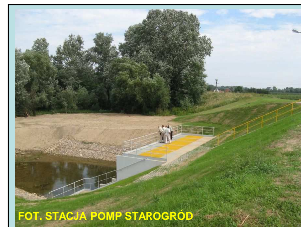
FOT. STACJA POMP STAROGRÓD