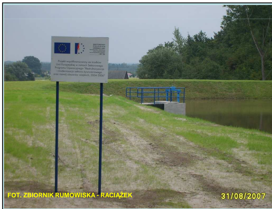
FOT. ZBIORNIK RUMOWISKA - RACIAŻEK