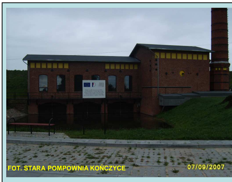
FOT. STARA POMPOWNIĄ KOŃCZYCE