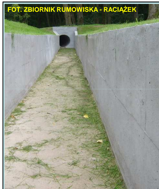
FOT. ZBIORNIK RUMOWISKA - RACIAŻEK