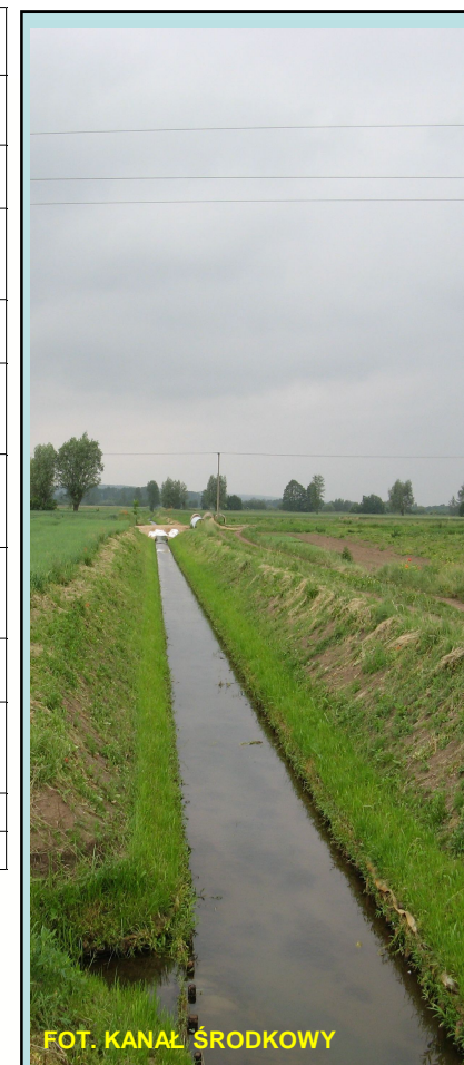
FOT. KANAŁ ŚRODKOWY