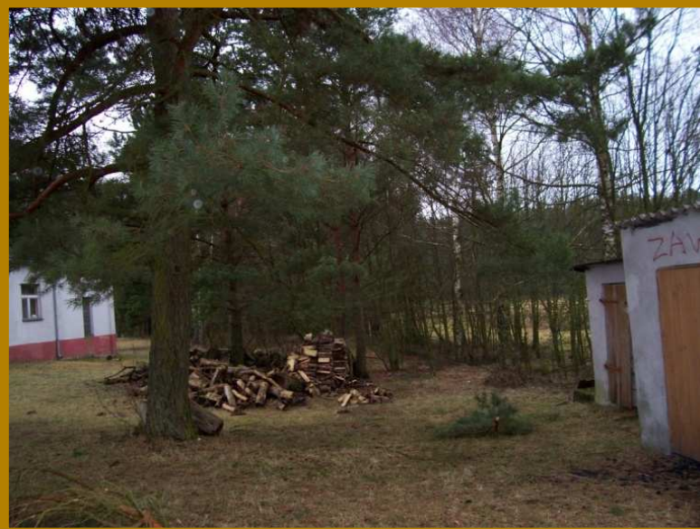
Działanie 1. Kompleksowy remont budynku świetlicy i remizy OSP z adaptacją pomieszczeń dla planowanych celów;