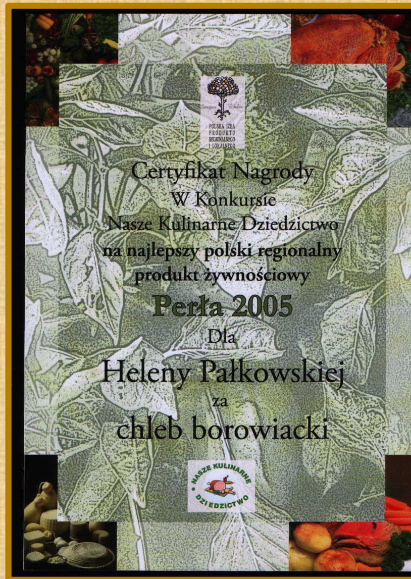
Historia „chleba borowiackiego”