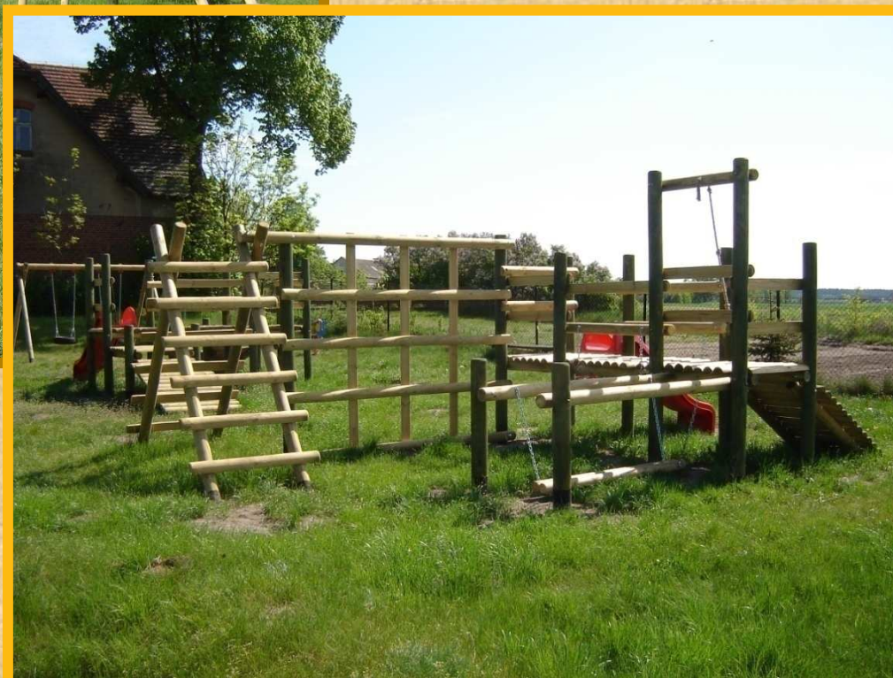
Plac zabaw przy świetlicy wiejskiej w Brzoziu