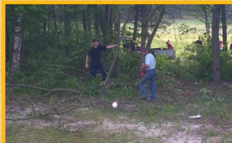
zagospodarowanie terenu wokół świetlicy