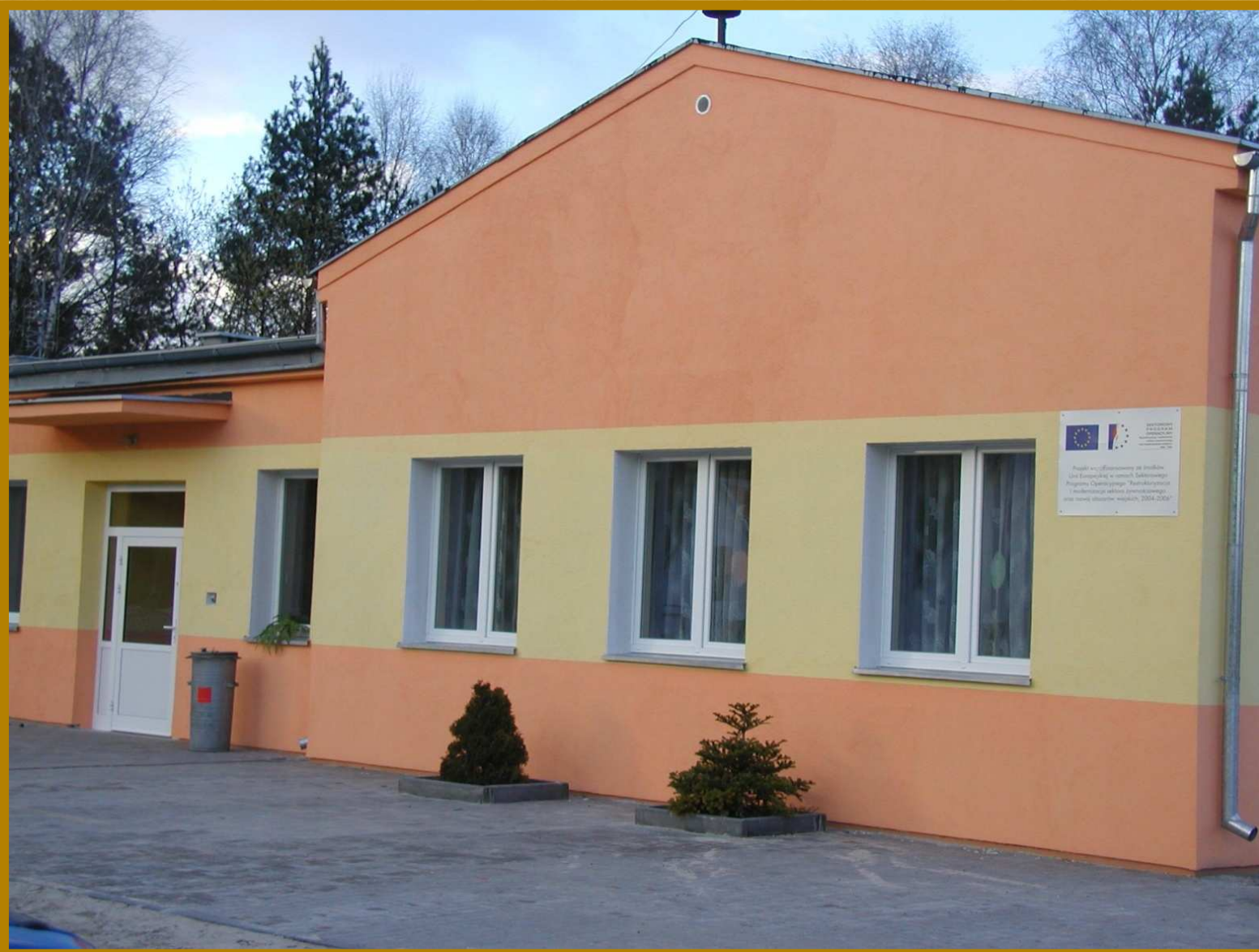
4. Remont i modernizacja świetlic oraz ich wyposażenie w miejscowościach Ludwichowo, Trzebciny, Wielkie Budziska i Zielonka