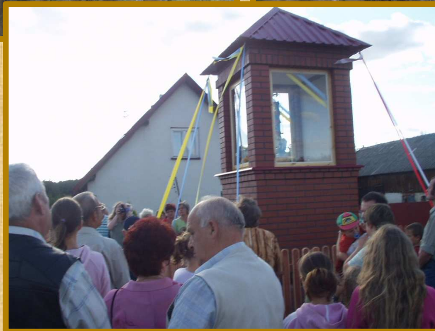
Odrestaurowanie starej kapliczki przydrożnej