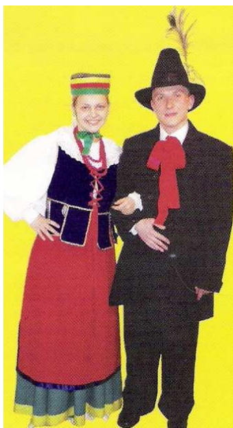
Fot. Strój dobrzyński

i spódnicy, która mogła mieć kolor beżowy, zielony, niebieski, pomarańczowy lub bordowy. Szyję zdobiły czerwone korale. Noszono także gorset, białe pończochy, a na nogach skórzane trzewiki. Na zwinięty warkocz wkładano toczek. Strój męski składał się z koszuli, spodni i czamary uszytych z granatowego sukna oraz butów z długimi cholewkami. Głowę zdobił czarny filcowy kapelusz z pawim piórkim lub rogatywka obszyta barankiem.